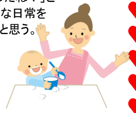
(文責 池澤 千恵子)

『いけざわこどもクリニック通信』は当院ホームページの「クリニック通信」ページからもご覧頂けます。(PDF形式・カラー版)第1号からの通信がありますので、よろしければお読みください。