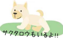
サクラウもいるよ!!